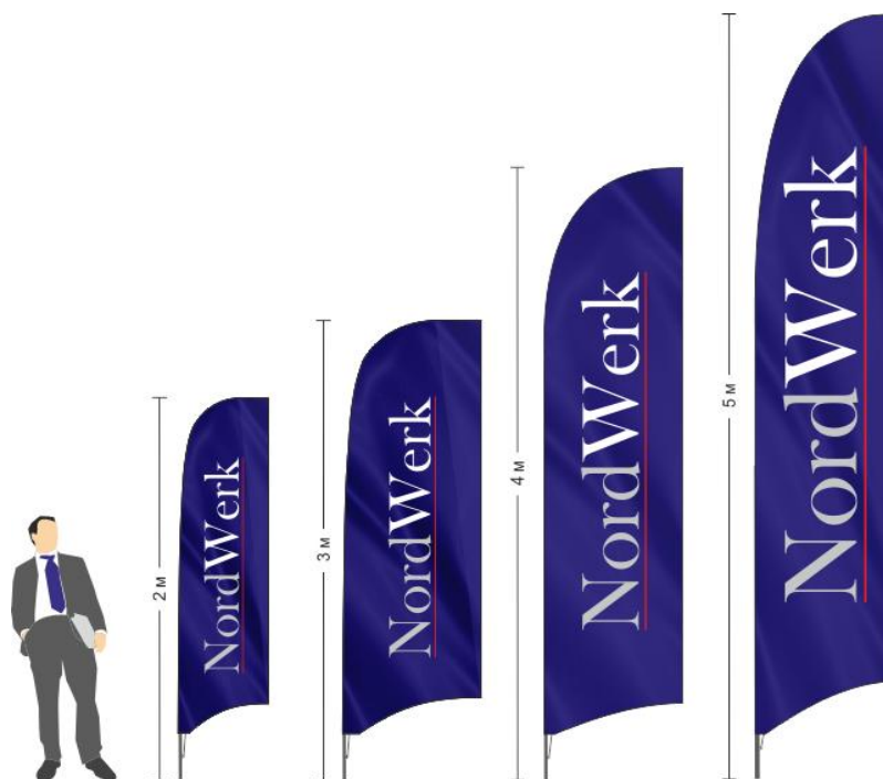
Флагштоки Виндер Флекс