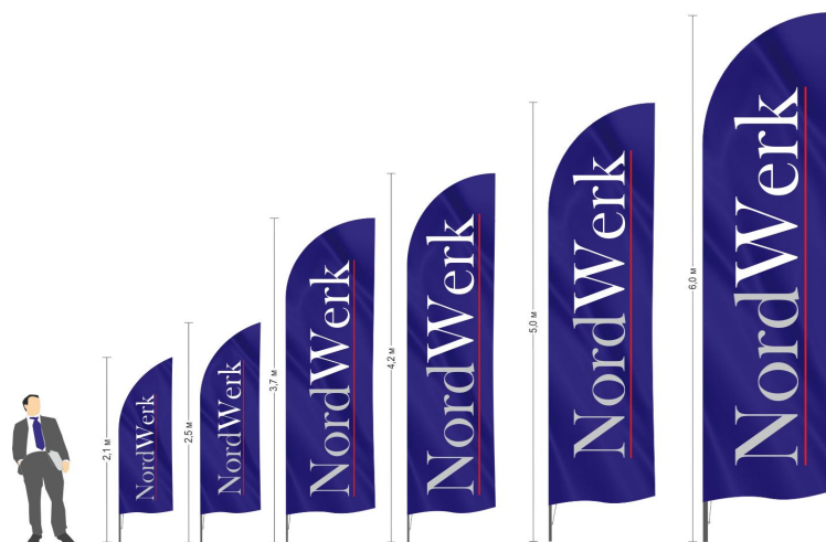
Флагштоки Виндер Парус