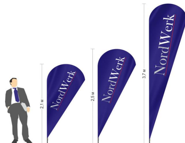
Флагштоки Виндер Капля